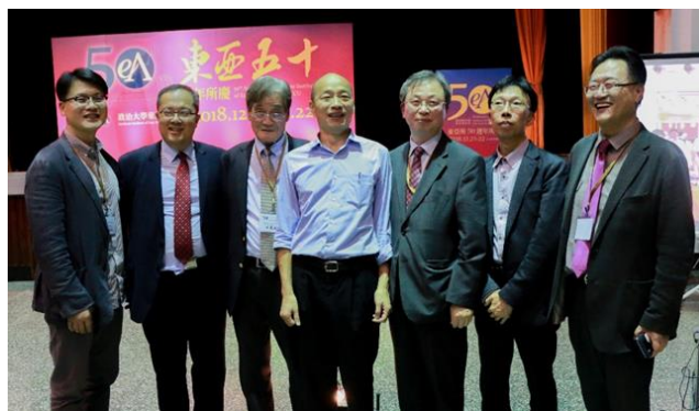
▲ 來訪教授與所友合影 ▼ 在校生合影